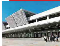
豊洲市場を視察する都議会自民党議員団

都民に「安全安心な食料品を安定して供給」していくには近代化的かつ持続可能な豊洲市場への移転しなくてはなりません！